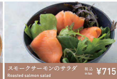
スモークサーモンのサラダ Roasted salmon salad 税込 in tax ¥715

甘海老本来の甘みと、味わいがしっかりとした福井のベビーリーフをサッパリとサラダに仕上げました。