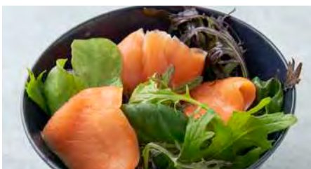
スモークサーモンのサラダ Roasted salmon salad

薄くスライスした“とみつ金時”のさつまいもと、香ばしい味わいの“打ち豆”を大学芋風なチップスに仕立てました。