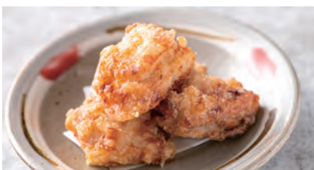
塩麴のから揚げ Fried chicken with Shio Koji