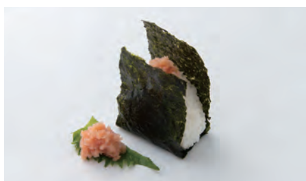
明太子 Spicy cod roe