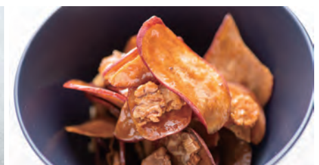
とみつ金時の大学芋チップ Potato chips