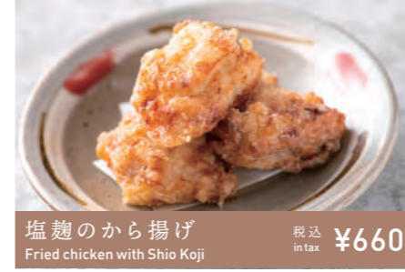
塩麹のから揚げ Fried chicken with Shio Koji 税込 in tax ¥660