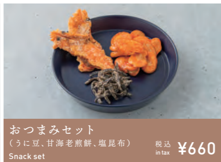
おつまみセット (うに豆、甘海老煎餅、塩昆布) Snack set 税込 in tax ¥660