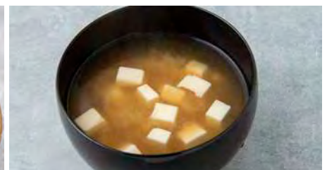
味噌汁 Miso soup

三国港で水揚げされた甘海老の甘みと、自然豊かな福井の大地で育てられたベビーリーフを越前塩で仕上げました。