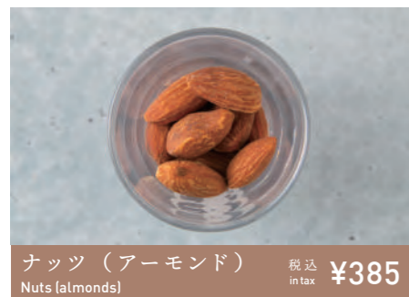
ナッツ (アーモンド) Nuts (almonds) 税込 in tax ¥385