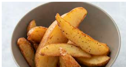
フライドポテト French fries