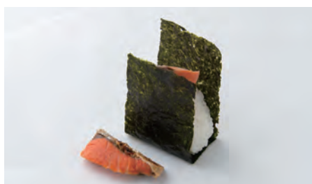
福井サーモン Fukui salmon