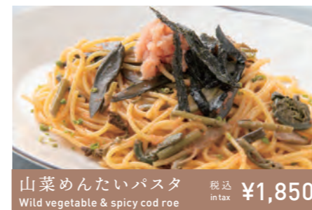
山菜めんたいパスタ Wild vegetable & spicy cod roe 税込 in tax ¥1,850