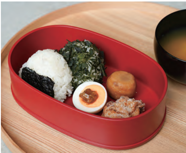
福井のおかずセット Onigiri and Fukui side dish set

甘く炊いた、ねっとり、ほくほく、でも煮崩れしない大野の“上庄里芋”を煮っ転がしに、香りが良い“ねぎ味噌”を楽しめる味噌卵、塩麴に漬けた唐揚げをおにぎりに合わせたお弁当。