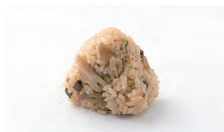
山菜炊き込み Wild vegetables