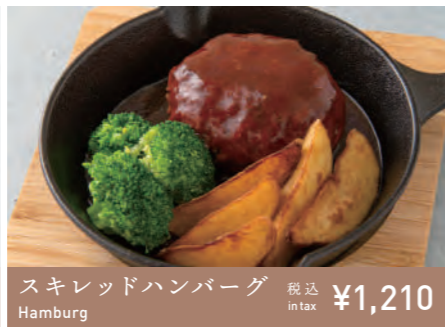
スキレットハンバーグ Hamburg 税込 in tax ¥1,210