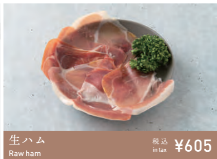
生ハム Raw ham 税込 in tax ¥605