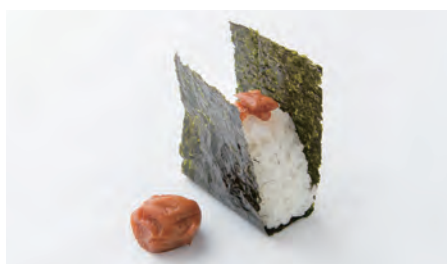
福井梅 Fukui plum

味わい深い肉厚の“福井梅”と粒感のある“いちほまれ”のコラボレーションは、噛むほどに美味しさを感じられるおにぎり