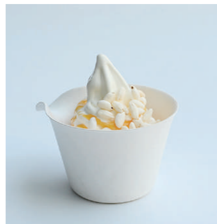
福井梅 完熟梅じゃむ Fukui plum

完熟の“福井梅”を使った梅ジャムとソフトクリームにベストマッチのボン菓子のをせました