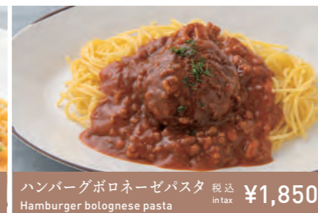
ハンバーグボロネーゼパスタ Hamburger bolognese pasta 税込 in tax ¥1,850

奥越産の山菜と明太子の相性をお楽しみください。ピリッと辛い実山椒のアクセントが食欲をそそります。