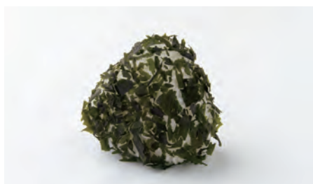
もみわかめ Wakame seaweed