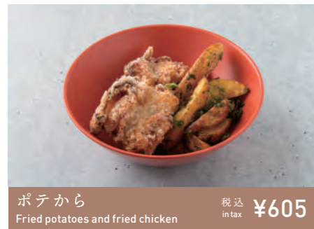
ポテから Fried potatoes and fried chicken 税込 in tax ¥605