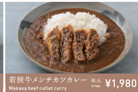
若狭牛メンチカツカレー Wakasa beef cutlet curry 税込 in tax ¥1,980