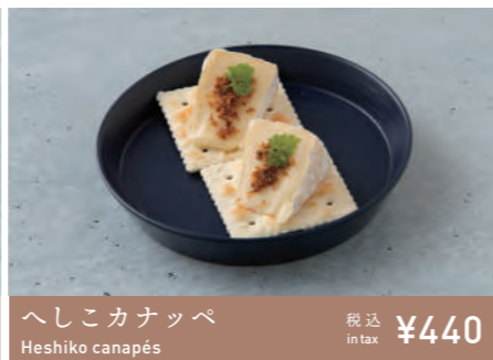
へしこカナッペ Heshiko canapés 税込 in tax ¥440