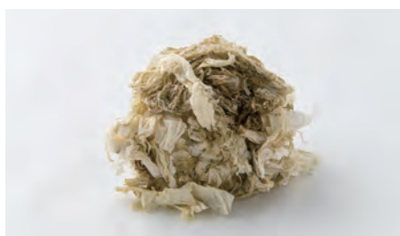
おぼろ昆布 Granted yam kelp

味わい深い肉厚の“福井梅”と粒感のある“いちほまれ”のコラボレーションは、噛むほどに美味しさを感じられるおにぎり