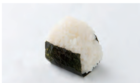
塩むすび Salty rice ball