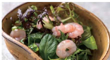
甘海老のサラダ Sweet shrimp salad