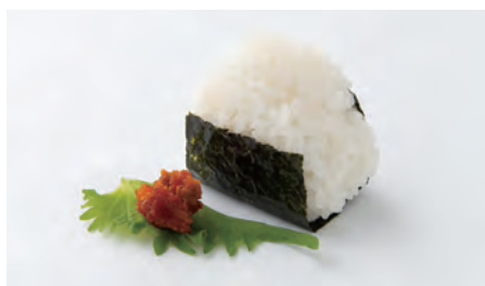
汐うに Salty urchin