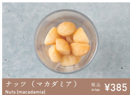
ナッツ (マカダミア) Nuts (macadamia) 税込 in tax ¥385