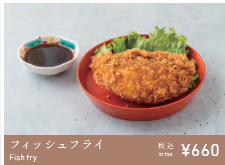
フィッシュフライ Fish fry 税込 in tax ¥660