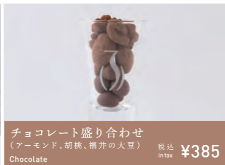
チョコレート盛り合わせ (アーモンド、胡桃、福井の大豆) Chocolate 税込 in tax ¥385