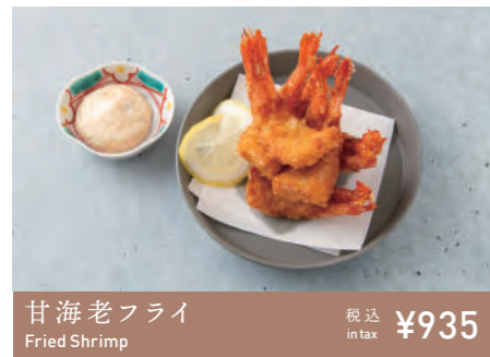
甘海老フライ Fried Shrimp 税込 in tax ¥935