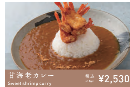
甘海老カレー Sweet shrimp curry 税込 in tax ¥2,530