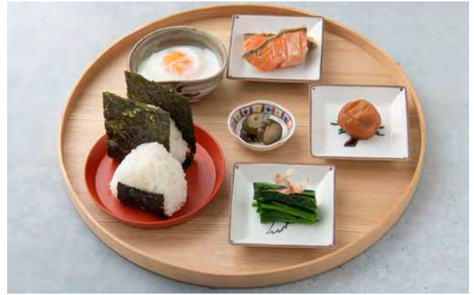
おにぎりセット (塩むすびと昆布おにぎり)