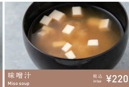
味噌汁 Miso soup 税込 in tax ¥220

ふんだんに盛り付けた甘海老フライと、甘海老パウダーの追いがけて、甘海老好きにはたまらないカレー。