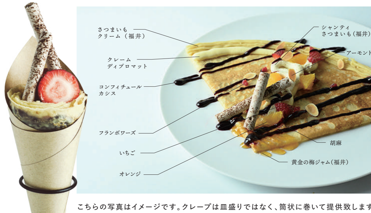
こちらの写真はイメージです。クレプは皿盛りではなく、筒状に巻いて提供致します。