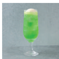
さわやかフロート Sawayaka soda float 税込 in tax ¥550