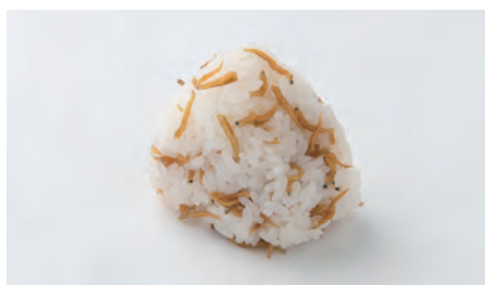
じゃこ Dried young sardines