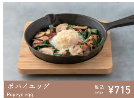
ポパイエッグ Popeye egg 税込 in tax ¥715