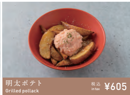
明太ポテト Grilled pollack 税込 in tax ¥605