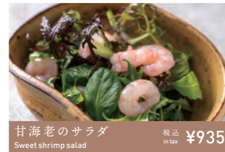
甘海老のサラダ Sweet shrimp salad 税込 in tax ¥935