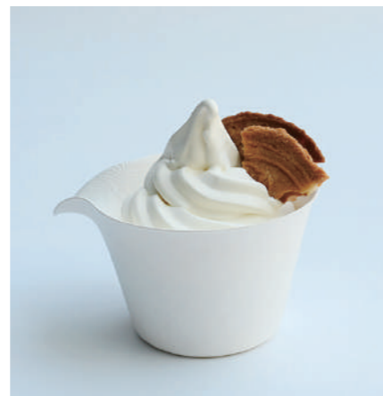
プレーン (福井銘菓付き) Plane