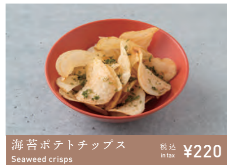
海苔ポテトチップス Seaweed crisps 税込 in tax ¥220