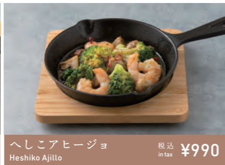
へしこアヒージョ Heshiko Ajillo 税込 in tax ¥990