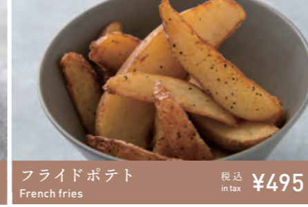
フライドポテト French fries 税込 in tax ¥495