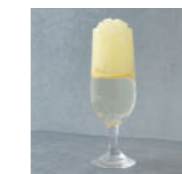
BENIレモンサイダー Plum & Lemon Soda 税込 in tax ¥660

べにさし梅を使用した微炭酸飲料に クラッシュ状のレモン果汁の氷を合わせたさわやかなドリンク