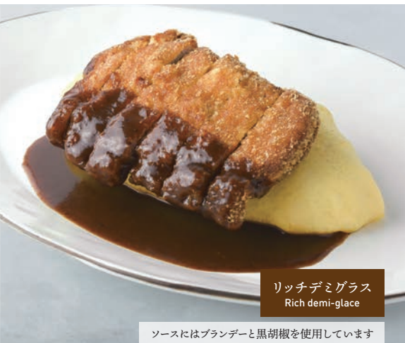
リッチデミグラス Rich demi-glace